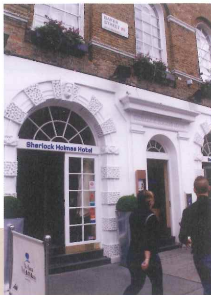
The Sherlock Holmes Hotel, London