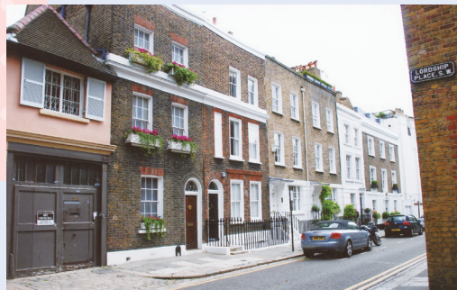
Flats in London