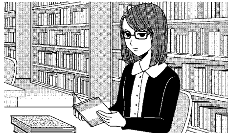
(a) (b) (c) (d)